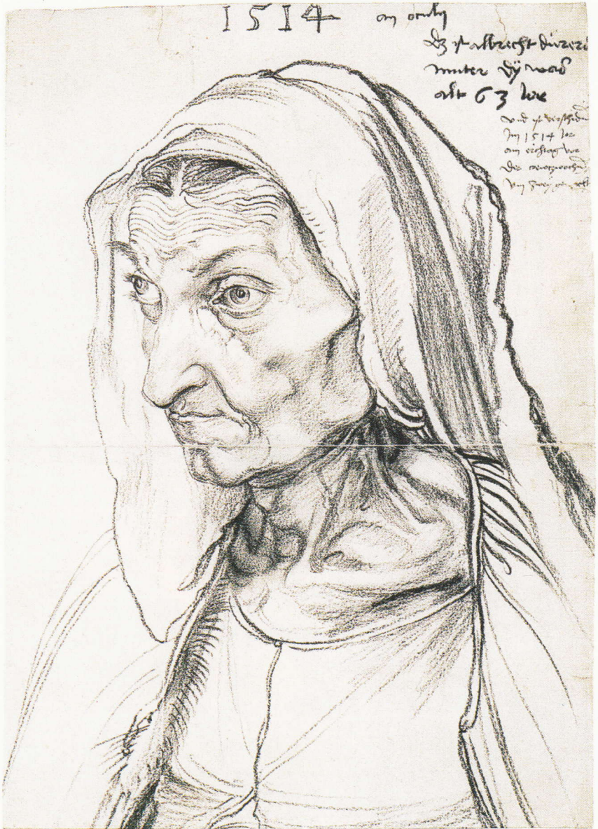
Albrecht Dürer, Mama artistului, 1514 desenat pe hârtie, 14,2 x 20,3 cm. Berlin, Staatliche Museen, Kupferstich Kabinett

Albrecht Dürer a desenat portretul mamei sale (il. 2) cu aceeași dragoste și devoțiune cu care a schițat Rubens chipul fiului său. Acest studiu pătrunzător al bătrâneții poate să ne șocheze, dar, dacă luptăm contra acestui dezgust instinctiv, vom fi pe deplin recompensați. Pentru că, în teribila lui sinceritate, desenul lui Dürer este o capodoperă. Vom înțelege