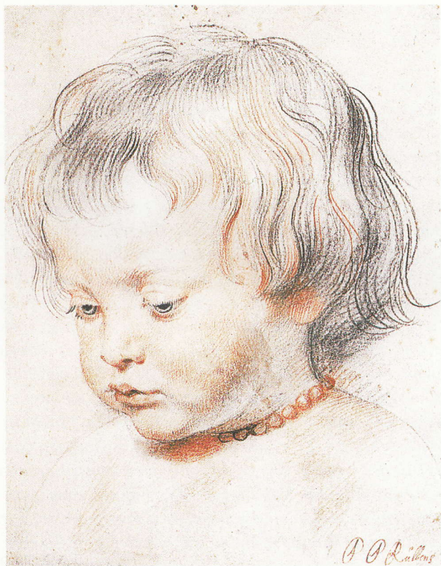
I Pieter Paul Rubens, Portretul fiului său Nicolas , cca 1620 cârbune și sanguină pe hârtie, 25,2 x 20,3 cm. Viena, Graphische Sammlung Albertina